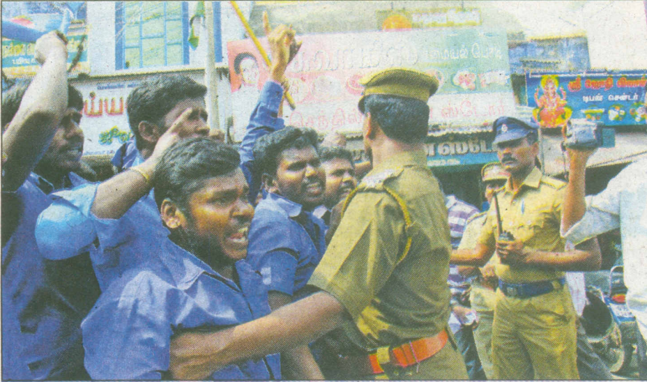
கேரளாவில் தமிழர்கள் தாக்கப்படுவதை கண்டித்து டவுனில் உள்ள நகைக்கடைமுன் ஆர்ப்பாட்டம் செய்த ஆதித்தமிழர் பேரவையினரை போலீசார் கைது செய்தனர்.