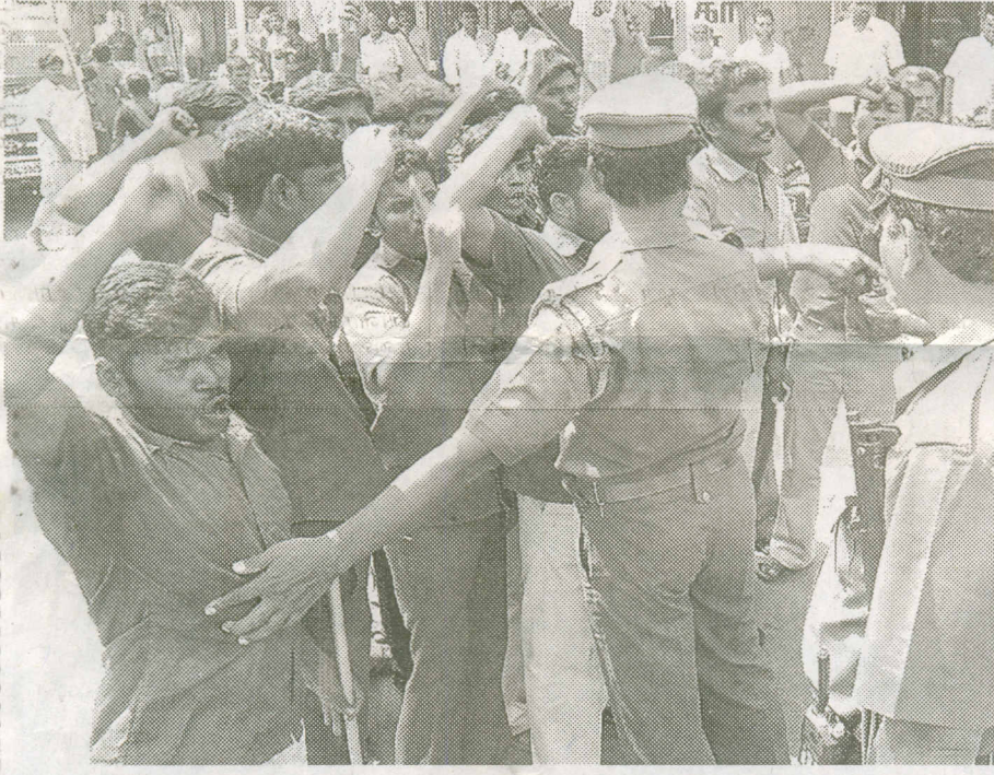
திருநெல்வேலி மேல ரத வீதியில் நகைக் கடையை முற்றுகையிட முயன்ற ஆதித்தமிழர் பேரவையினரை தடுத்து நிறுத்தும் போலீஸார்.

திருநெல்வேலி, டி.ச. 9: திருநெல்வேலி நகரத்தில் நகைக் கடையை முற்றுகையிட முயன்ற ஆதித் தமிழர் பேரவை அமைப்பைச் சேர்ந்த 17 பேரை போலீஸார் வெள்ளிக்கிழமை கைது செய்தனர். முல்லைப் பெரியாறு அணைக்குப் பதிலாக புதிய அணை கட்ட முயற்சி மேற்கொண்டு வரும் கேரள அரசின் நடவடிக்கைக்கு எதிர்ப்பு தெரிவித்து தமிழகத்தில் பல்வேறு அரசியல் கட்சிகள் மற்றும் அமைப்பினர் போராட்டம் நடத்தி வருகின்றனர். இந்நிலையில், கோவை,