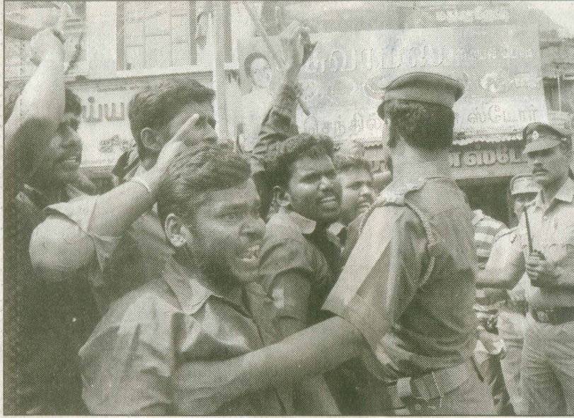
தமிழர்கள் தாக்கப்படுவதைக் கண்டித்து டவுனில் உள்ள கேரளாவைச் சேர்ந்த நகைக்கடைகள் முன்பு மறியல் செய்ய முயன்ற ஆதித்தமிழர் பேரவையினரை போலீசார் மடக்கிப்பிடித்து கைது செய்தனர்.